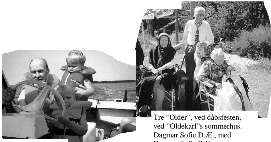
Sommertur i Bedstemors skiv.