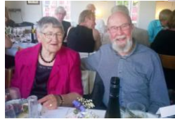
Salisbury, England, 4. juli 2015