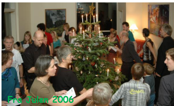
Fra Julen 2006